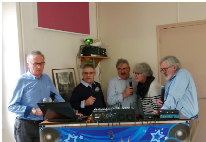
Quand les élus poussent la chansonnette