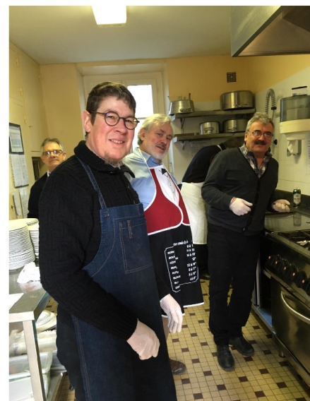
Quand les élus sont aux fourneaux

Il n'était pas banal, ce repas 2020 ! Les messieurs du Conseil municipal avaient concocté un repas sympathique (Coquilles St Jacques aux chicons, rôti en croute sauce forestière, fromages et gaufres bruxelloises) et avaient pris plaisir à jouer les maitres queux l'espace d'une journée.