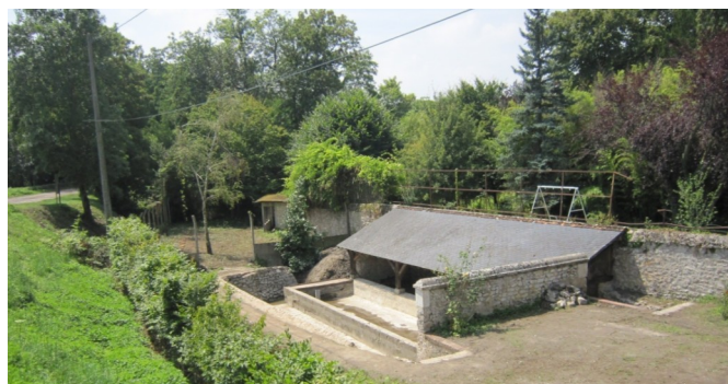
Un beau lifting avant la restauration du site