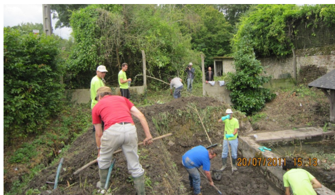
Une équipe dynamique et efficace