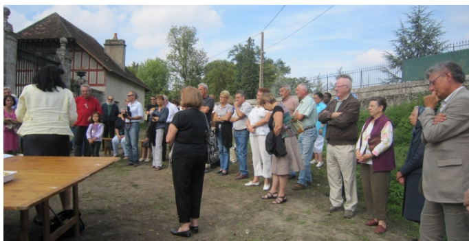
Un pot sympathique offert à la population par les membres du groupe